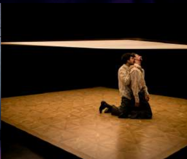
LOS PERROS 2022