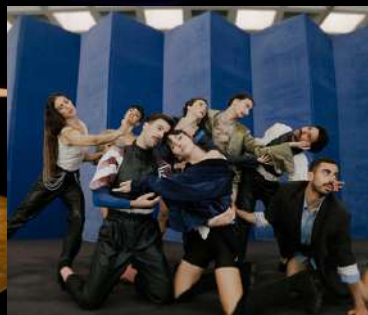
ESQUICIO (videodanza) 2022